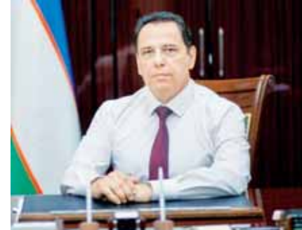
фалар ижроси юзасидан қатор чора-тадбирлар ишлаб чиқилди. Хусусан, белгиланган дастурлар ижросини таъминлаш юзасидан айна пайтда Қорақалпоғистон Республикасида тарихий қадимжолар, объектларни ривожлантириш ўрналимоқда.

Бугунги кўнда давлат томонидан туризм инфратузилмаларини жадал ривожлантириш, янгидан-янги иш ўринлари яратишда Қора-