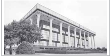
Ўқув ташкил этилиб, методик қўлланма, намунавий тақдимот ва зарур маълумотлар тайёрланди.

Ўзбекистон Халқ демократик партияси фракцияси йигилишида таъкидланганидек, мазкур жараёнда ХДПнинг барча даражадаги ташкилотлари ва депутатлик корпуси фаол қатнашишига алоҳида эътибор қаратилди. Хусусан, экспертлар учун