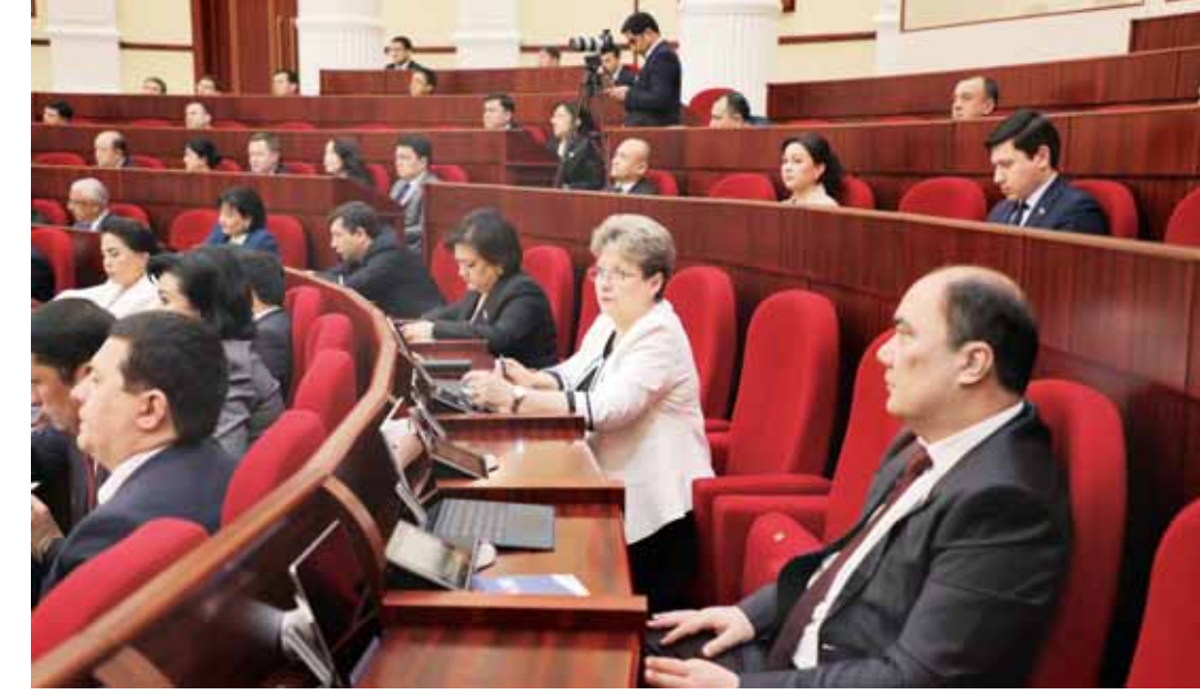
даромад солигини камайитириш ҳуқуқи берилмокда.

Ушбу ҳужжат лойиҳасида тадбиркорларга маркировка қўрилмаганлиги сотиб олиш харажатлари суммасига фойда, айланмадан олинадиган солиқ ва яққа тадбиркорлар учун