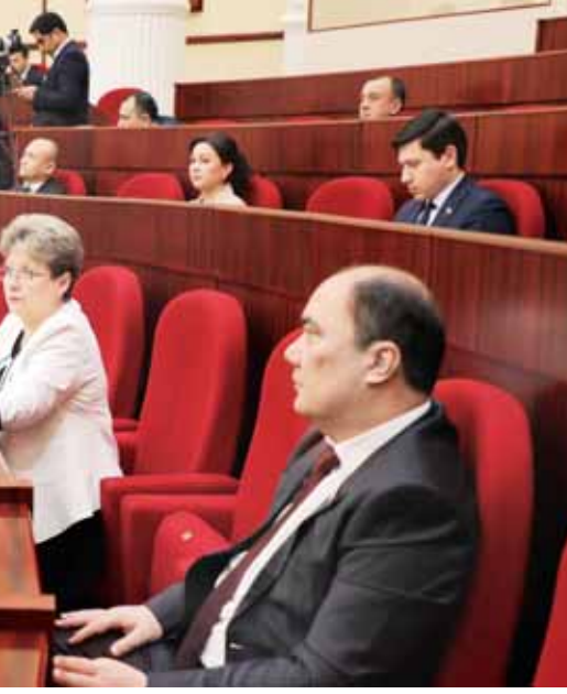
қисқартириш борасидаги ислохотларни ўзига акс эттириб, у билан амалдаги 3 та кодекс ва 5 та қўнунга тегишли ўзгартриш ва қўшимчалар киритиш тақдир қилинмокда.

Лойиҳа лицензиялаш, рўхсат бериш ва хабардор қилиш тартиб-таомилларини